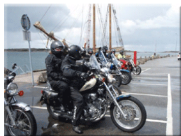
MC –sektionen i Grebbestad